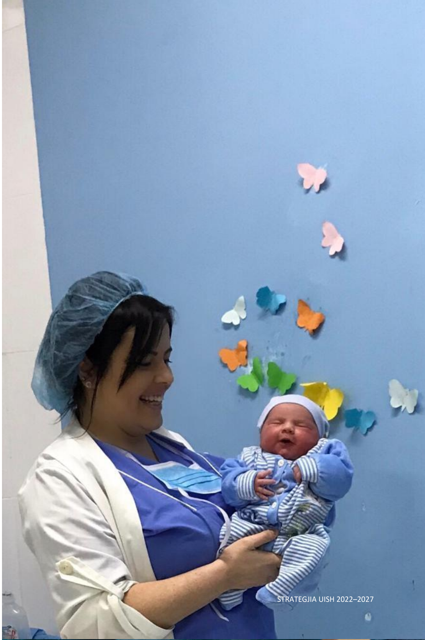
STRATEGJIA UISH 2022–2027

“Punë të sigurt, efektive dhe të sjellshme të infermierëve dhe punonjësve të kujdesit, duke përmirësuar shëndetin dhe mirëqenien e të gjithëve”.